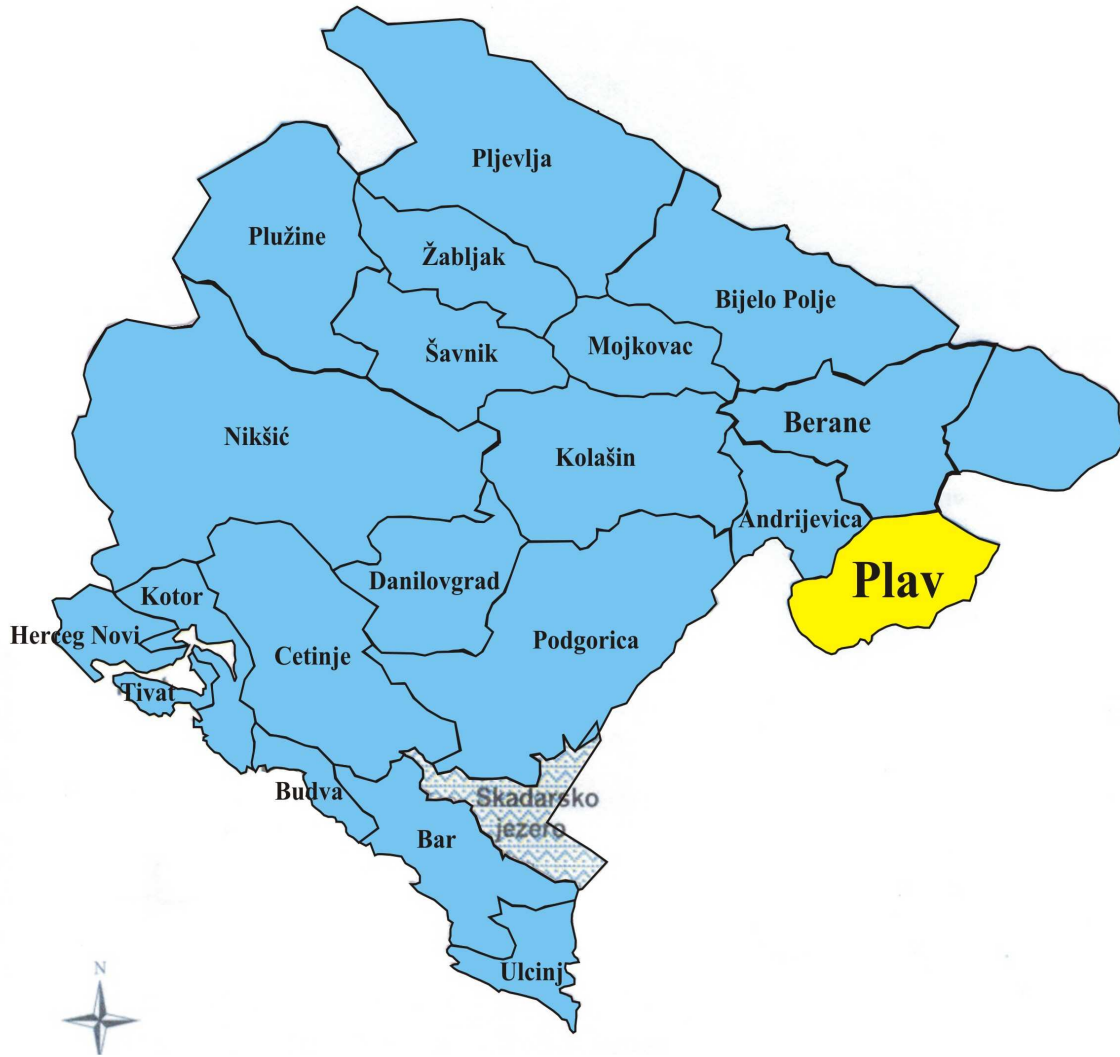
Slika 1. Položaj opštine Plav u Crnoj Gori